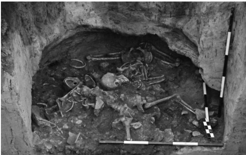
Obr. 10. Kunovice. Pohřeb v sídlištní jámě.

Hrubý, V., Hochmanová, V., Kalousek, F. 1956: Kunovice, Knížecí a Nedbalova cihelna. In: V. Hrubý (ed.): Přehled nejvýznamnějších archeologických lokalit Gottwaldovského kraje . Studie Krajského musea v Gottwaldově. Gottwaldov: Krajské museum v Gottwaldově, 68–70.