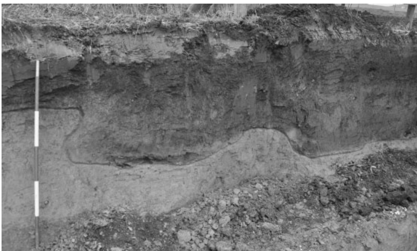
Obr. 17. Velatice. Řez pecí a příkopem na neolitickém sídlišti; dům rodiny Ludvíkova na p.č. 2036/10.

A collection of Moravian Painted Ware culture pottery fragments and a stone axe were found during a surface survey at Zdounky.