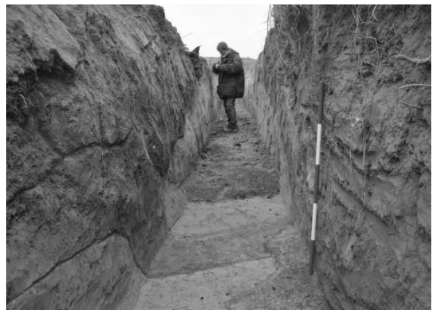
Obr. 6. Oslavany. Palisádový žlab neolitické osady před jeho výzkumem.

Oslavany (Bez. Brno-venkov). „Oslavanská stará hora“. MBK. Siedlung. Rettungsgrabung.