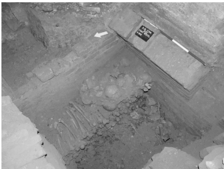
Obr. 140. Zlín (k. ú. Štípa), kostel Narození Panny Marie. Skládka kostí v jižní kryptě.

Při přeložce plynovodu v jižní části náměstí byly objeveny zbytky zborcené klenby. Proto zde byla provedena sondáž, při které se podařilo odkrýt část zasypané barokní stoky budované z cihel. Vrchol klenby se předpokládá v hloubce 1,3 m od stávajícího terénu, dno stoky se pak nacházelo v hloubce 2,3 m. Zachovalá část tunelu byla vyplněna mazlavým blátem tmavé barvy. Jedná se patrně o zanesený trativod. Druhá stoka byla zachycena při stavbě kanalizace také v jižní části náměstí a byla