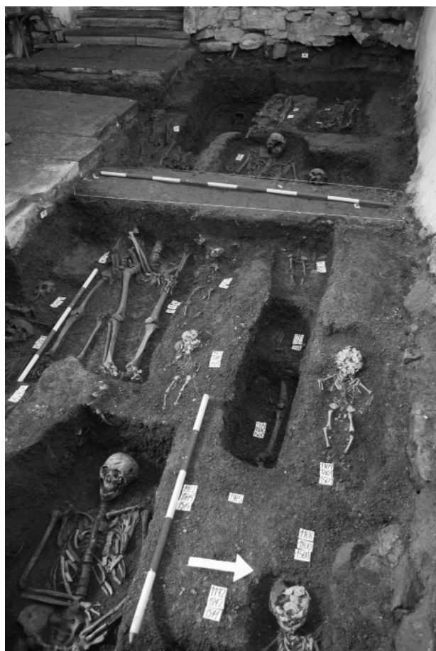
Obr. 125. Štramberk, místní část Tamovice, kostel sv. Kateřiny. Interiérové pohřby v severní části lodi. Sonda S1, pohled od východu. Foto F. Kolář.

Abb. 125. Štramberk, Ortsteil Tamovice, St.-Katharinen-Kirche. Kirchenbestattungen im nördlichen Teil des Schiffes. Grabungsschnitt S1, Blick von Osten. Foto F. Kolář.