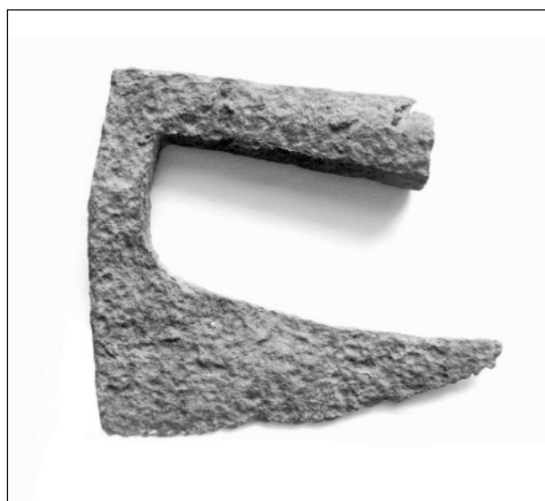
Obr. 122. Svitavy (k. ú. Moravský Lačnov). Sekera.