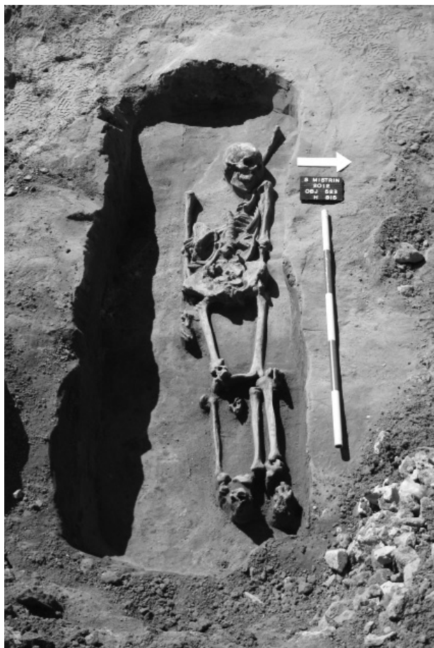
Obr. 120. Svatobořice-Mistřín (okr. Hodonín). Pohled na prozkoumaný kostrový pohřeb.