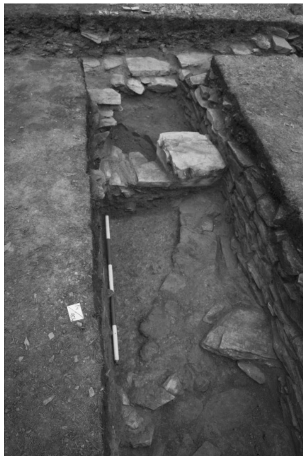
Obr. 119. Staré Město u Bruntálu, areál kostela Neposkvrněného početí Panny Marie. Superpozice pozdně románské apsidy a zdiva gotické boční kaple v jižním sousedství presbytáře.

V souvislosti s budováním infrastruktury pro šest rodinných domů byl při jižním okraji intravilánu obce proveden záchranný výzkum (2010–2011, Národní památkový ústav, územní odborné pracoviště Ostrava, akce č. 55/11). V místech příjezdové komunikace a na parcelách budoucích staveb rodinných domů byla skryta ornice. Při ručním začišťení podorniční vrstvy byl nalezen jeden zdobený keramický fragment nádoby, rámcově datovatelný do 13. století (obr. 116) a menší shluk fragmentů mazanice. Dále bylo z této uloženiny získáno na tři desítky novověkých keramických fragmentů nádob, z nichž zhruba polovina nesla stopy po glazování. V západním