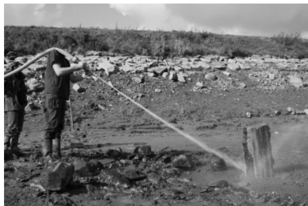
Obr. 117. Spytihněv. Začišťování stavebních článků z destrukce kostela v řečišti Moravy.

Původní dřevěný katolický kostel zasvěcený taktéž sv. Anně stával jinde – nedaleko bývalého fojtství v místě dodnes uváděného jako tzv. starý hřbitov, cca 0,5 km od současného kostela. S převahou obyvatel protestantského vyznání v 16. století byl v letech 1595–1596 za podpory Bernarda Barského z Baště vystavěn nový protestantský kostel stylově ještě odpovídající pozdně gotickému slohu. Kostel prodělal několik změn; na místě původní sakristie vznikla na konci 19. století kaple Božího hrobu, nová sakristie pak byla vystavěna na opačné, tedy jižní straně. Tyto změny bylo možno postihnout také archeologicky, protože základy nové sakristie narušily starší pohřby. Na hřbitově okolo kostela se pohřbívalo do roku 1908. Hřbitovní zídka byla stržena za německé okupace, stejně jako zanikly veškeré pozůstatky hřbitova; dnes již hřbitov není