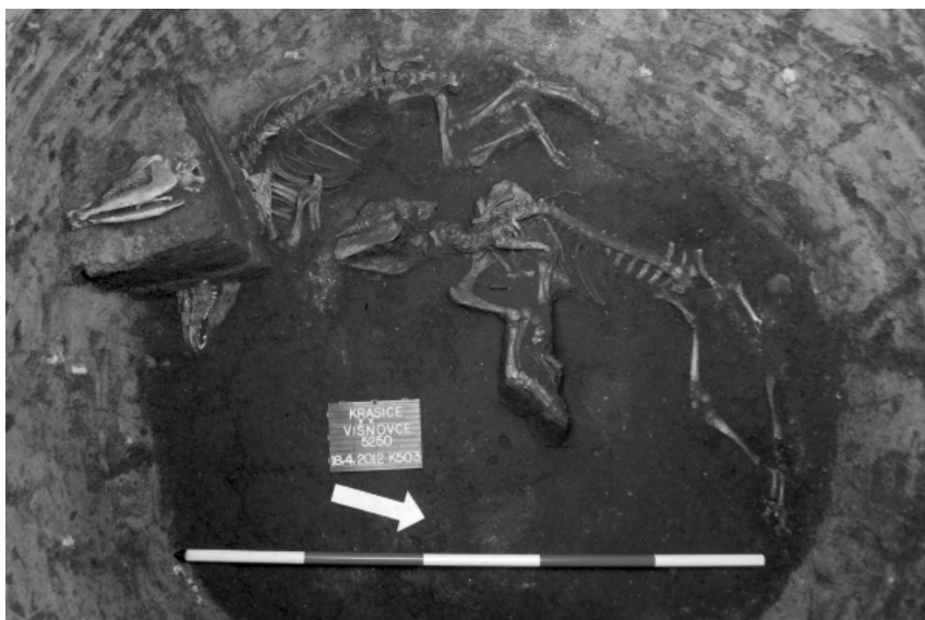
Obr. 113. Prostějov (k. ú. Krasice), „Višňovce“. Pohled na zvířecí skelety ve výplni objektu č. 503.

Abb. 113. Prostějov (Kat. Krasice), „Višňovce“. Ein Anblick auf die Tierskelette in der Objektfüllung (Obj. Nr. 503).