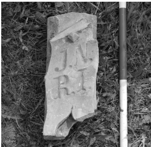
Obr. 111. Počenice-Tetětice. Část kamenného kříže. Abb. 111. Počenice-Tetětice. Ein Teil des Steinkreuzes.

V březnu roku 2012 uskutečnili pracovníci Ústavu archeologické památkové péče Brno, v. v. i., záchran- ný archeologický výzkum na severozápadním okraji polní trati „Díly v zadní trati“ v souvislosti s výstavbou nového výtlačného vodovodního řadu. Dosud neznámá lokalita se nachází přibližně 1,5 km jižně od středu intravilánu městyse a je situována v nadmořské výšce od 320 do 322