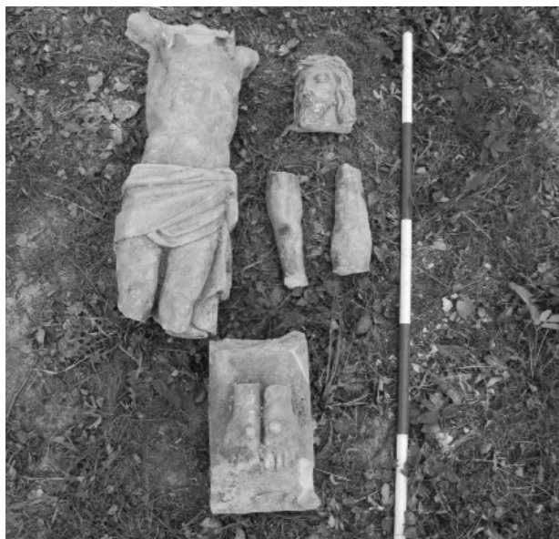
Obr. 110. Počenice-Tetětice. Rozlámaná socha Krista. Abb. 110. Počenice-Tetětice. Zerbrochene Christus-Skulptur.