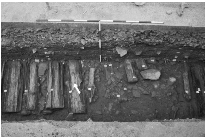
Obr. 60. Klimkovice, ulice Čs. legii. Sonda S3 – dřevěná cesta doplněná dlážděním, 18.–19. století. Pohled od jihu.