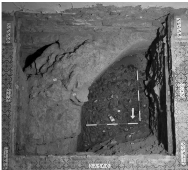
Obr. 58. Karviná, městská část Doly, kostel sv. Petra z Alkantary. Stavební pozůstatky boční kaple původního kostela sv. Martina s kryptou. Sonda S2, pohled od severu. Foto F. Kolář.

Abb. 58. Karviná, Stadtteil Doly, Kirche St. Peter von Alcantara. Baurelikten des Seitenschiffes der ehemaligen Martinskirche mit eine Gruft. Grabungsschnitt S2, Blick von Norden. Foto F. Kolář.