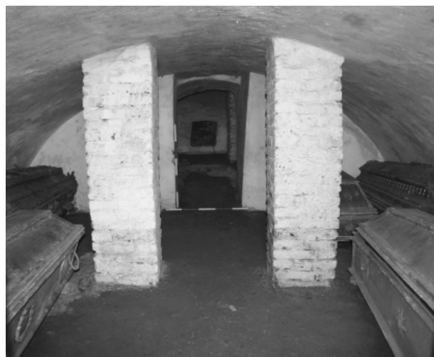
Obr. 59. Karviná, městská část Doly, kostel sv. Petra z Alkantary. Interiér krypty stávajícího kostela sv. Petra z Alkantary. Sonda S3, pohled od západu.

Samek, B. 1999: Umělecké památky Moravy a Slezska. II. díl, J-N. Praha: Academia.