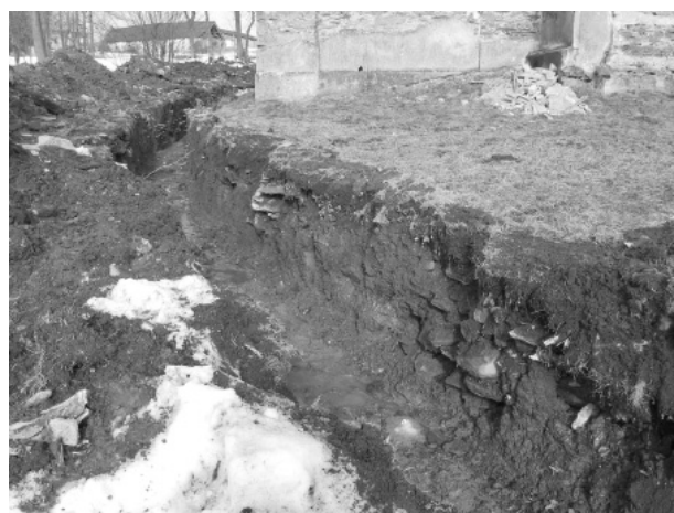
Obr. 56. Jiřikov, kostel sv. Michala. Profil P1 v sondě S1/12.

Abb. 56. Jiřikov, St.-Michael-Kirche. Profil-P1 in der Sonde S1/12.