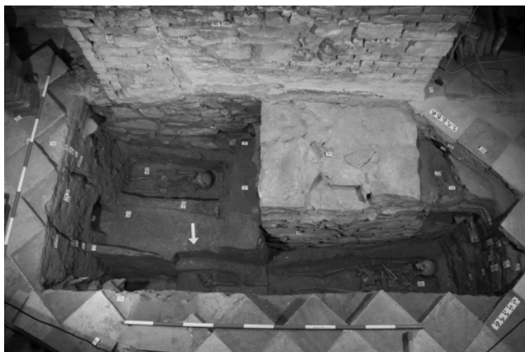
Abb. 52. Hrozová, Erzengel Michael-Kirche . Kirchenbestattungen im Südteil des Presbyteriums am Fuße des Triumphbogens, Blick von Norden. Foto F. Kolář.

Obr. 52. Hrozová, kostel sv. archanděla Michaela. Interiérové pohřby v jižní části presbytáře při patě vítězného oblouku, pohled od severu. Foto F. Kolář.