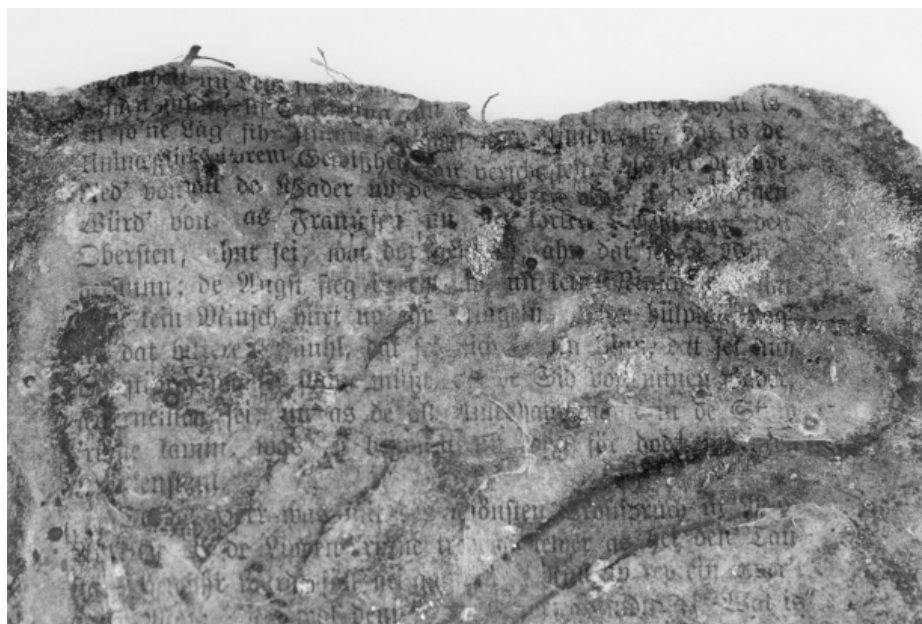
Abb. 49. Hodonín u Kunštátu. Beispiel einer Seite gedruckt in die Schwabacher Schrift.

velký střep prasklého litinového kotle a horní varnou část kamnové plotny. Mezi lékovkami byla nalezena rovněž dlouhá ampule s korkovým uzávěrem, obsahující dosud práškovou hmotu.