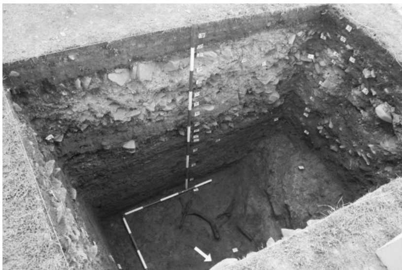
Abb. 47. Fulnek, Komenského náměstí (Platz), Treppe zur Kirche. Schnitt durch dem historischen First im Südteil des Platzes. Am Basis des Profiles ein Bett des natürlichen Wasserlaufes. Grabungsschnitt S5, Blick von Nordosten.

č. DF 11P01OVV029 „Výzkum historických cest v oblasti severozápadní Moravy a východních Čech“.