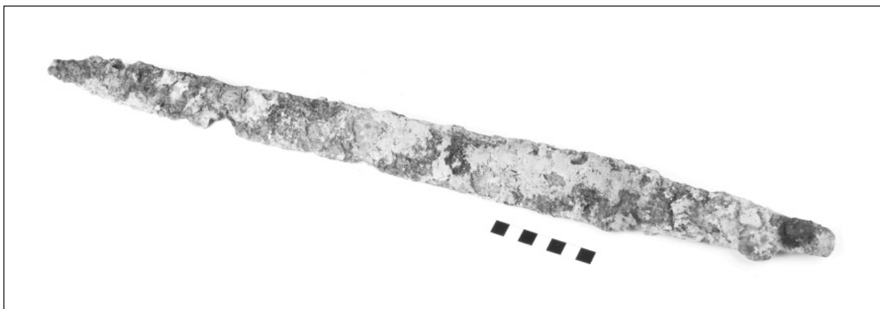
Obr. 2. Kostelec u Holešova. Meč před konzervací.