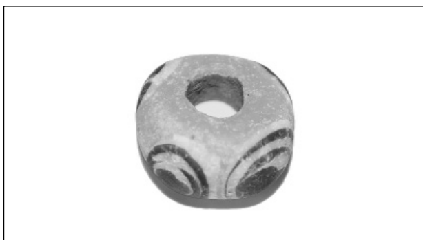
Obr. 2. Blažovice. Skleněný korál.