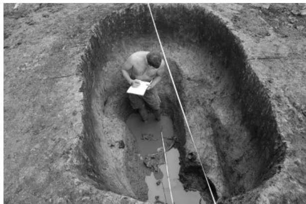
Obr. 15. Sudice. Dokumentace únětického hrobu.

Kostrové hroby nositelů únětické kultury byly většinou ještě v pravěku značně poznamenány druhotným (vykradačským?) zásahem, při němž byla zpřeházena či