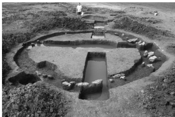
Obr. 16. Sudice. Kruh z kamenů.