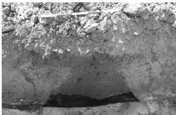
Obr. 13. Pozořice. Zásobní jáma se zachovanou vrstvou obilí na dně.

Abb. 13. Pozořice. Vorratsgrube mit erhaltener Getreideschicht auf dem Boden.