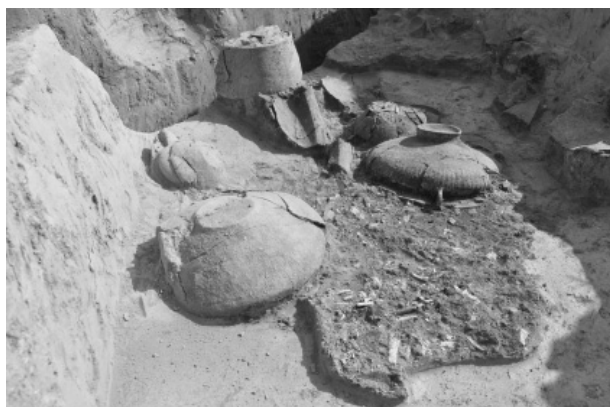
Obr. 12. Podolí. Žárový hrob velatické fáze KSPP.

Abb. 12. Podolí. Brandgrab mitteldonaulandischen Urnenfelderkultur.