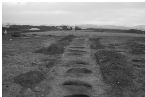
Obr. 5. Holešov, okr. Kroměříž. Třináct objektů ze starší doby bronzové v řadě.

Objekty tvořily dvě skupiny; poněkud volnější ve východní části zkoumané plochy a svým způsobem navazující na objekty prozkoumané v rámci kruhové křížovatky a poněkud semknutější skupinu západní. Hranici mezi oběma shluky objektů tvořila řada třinácti sklípků, even-