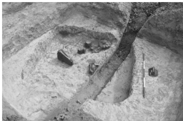
Obr. 9. Podolí. Kostrový hrob kultury se šňůrovou keramikou.