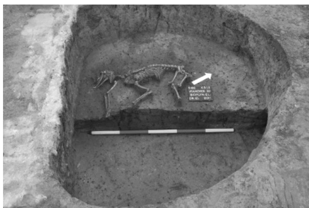
Obr. 2. Držovice. Pohřeb psa v sídlištním objektu 512 (jordanovská kultura).