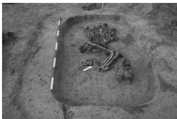
Obr. 3. Držovice. Hrob baalberské fáze kultury nálevkovitých pohárů.