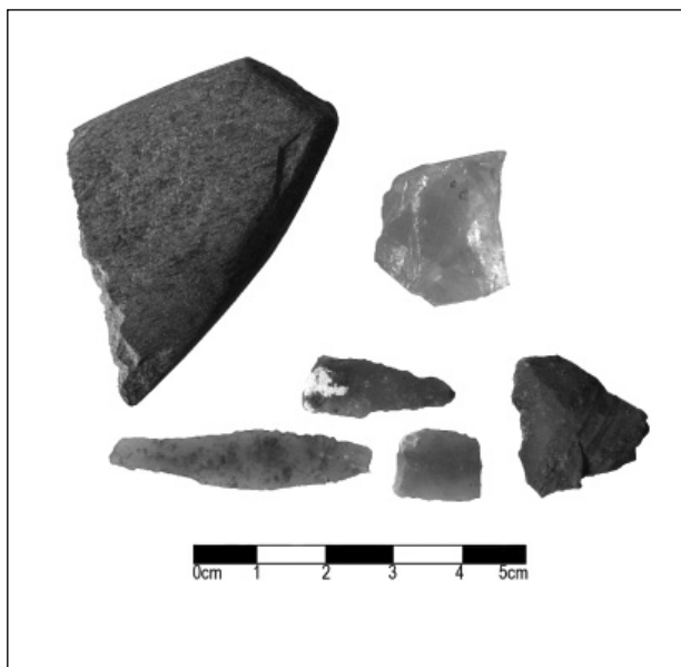
Obr. 3. Bohušice – rybník, objekt č. 500, kamenná industrie z kultury s MMK I. stupně.