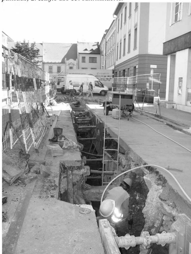
Obr. 137: Uherské Hradiště, ul. Na Splávku. Celkový pohled od jihozápadu. Abb. 137: Uherské Hradiště, Na Splávku-Straße. Gesamtansicht aus Südwesten.