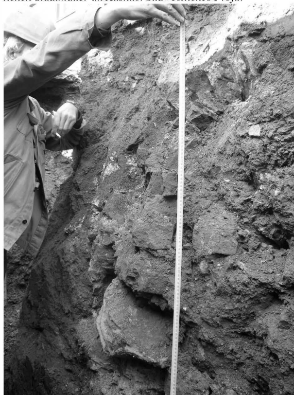
Obr. 138: Uherské Hradiště, Nádražní ul. Pozůstatek hradby ve výkopu. Severozápadní profil. Abb. 138: Uherské Hradiště, Nádražní-Straße. Torso der Stadtmauer im Aushub. Nordwestliches Profil.