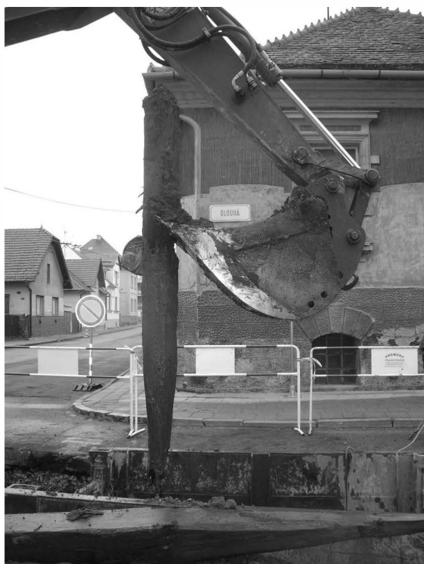
Obr. 135: Uherské Hradiště, ul. Dlouhá. Vytahování kůlu dubové palisády z druhé poloviny 15. století. Abb. 135: Uherské Hradiště, Dlouhá-Straße. Das Aufheben der Pfähle der Eichenpalisade, 2. Hälfte des 15. Jahrhunderts.