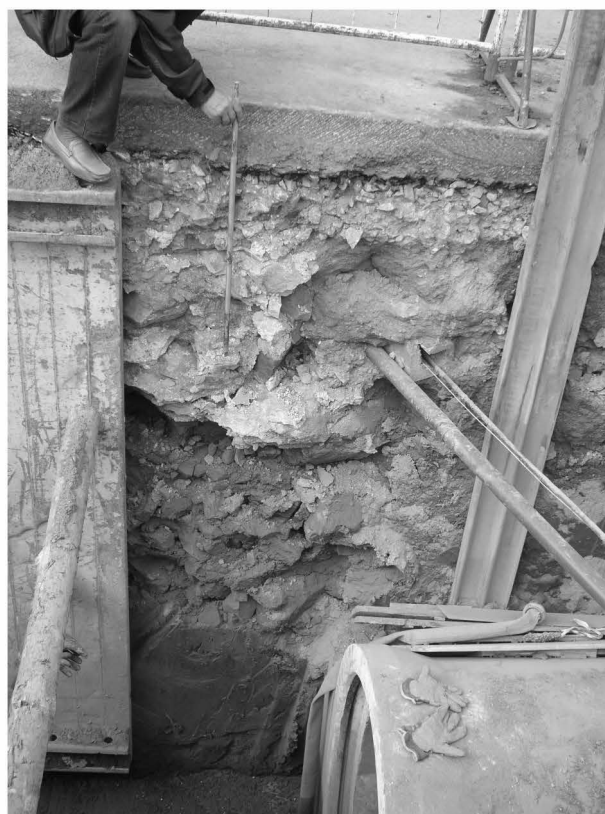
Obr. 136: Uherské Hradiště, ul. Sojákova. Pozůstatek vrcholně středověké hradby ve výkopu. Jihozápadní profil. Abb. 136: Uherské Hradiště, Soják-Straße. Torso der hochmittelalterlichen Stadtmauer im Aushub. Südwestliches Profil.