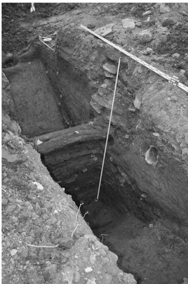
Obr. 127: Šumperk. Pohled na sondu S02 – příkop. Abb. 127: Šumperk. Blick auf die Sonda S02 – Bewässerungsgraben.

Parcela se nacházela na úpatí svahu kopce zvedajícího se jižním směrem k bývalým městským hradbám. V jižní části plochy, uměle navršené zřejmě již v raném novověku, se nacházely kostrové pohřby H1–H25. Převládala u nich jednotná orientace západ–východ. Jen v ojedinělých případech se vyskytla orientace V–Z nebo S–J. Věkové zastoupení tvořily tři kategorie – adultus (19 jedinců), infans (7 jedinců) a neonatus (1 jedinec). Pohlaví se podařilo určit u 11 jedinců (8 – muži, 3 – ženy). Hroby neobsahovaly žádný datační materiál. Avšak na základě písemné zmínky z roku 1624 je známo, že bylo luteránům vyčleněno nové místo pro pohřbívání vpravo od tzv. Nové brány, údajně v místě obranného příkopu. Sonda umístěná do současného svahu v rámci stavební plochy polyfunkčního objektu A (výzkum Vlastivědného muzea v Šumperku probíhající paralelně s výzkumem Archaia