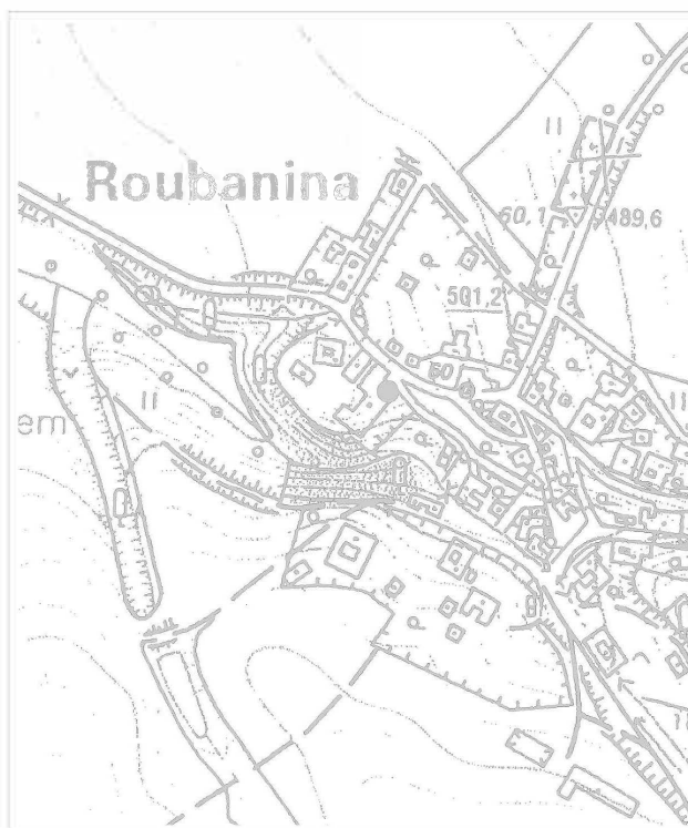
Obr. 119: Roubanina, vyznačení č. p. 32 v plánu obce. Abb. 119: Roubanina, Konstr. N. 2, Plan der Gemeinde.

Asi 50 m západním směrem od místa nálezu, na zahradě domu č. p. 4, se nachází vyvýšenina, snad pozůstatek po tvrzi. Lokalita se nachází nad strmým zalesněným svahem nad potokem, na ploše asi 15 × 9 m. Severně od ní se nacházejí zřejmě zbytky příkopu o šířce asi 17 m. Východně od vyvýšeniny, pod svahem, stojí přestavěné budovy dvora, uváděného v písemných pramenech k r. 1563.