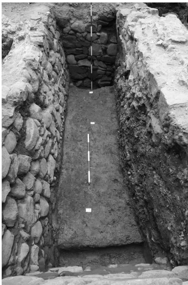
Obr. 113: Ostrava. Biskupská ulice. Pohled na zděný suterén od východu. Abb. 113: Ostrava. Biskupská Str. Blick in den steingemauerten Keller von Osten.

Hydrogeologická situace na lokalitě se ukázala jako klíčová, zejména pro období předcházející novověku. V celé ploše výzkumu nebyly v nadloží zjištěny starší než novověké nálezy, naopak v podloží tvořeném povodňovými hlínami byly registrovány vodou redeponované středověké až raně novověké keramické fragmenty. Ukázalo se tedy, že zkoumaný prostor byl při četných povodňích periodicky ovlivňován erozními a akumulacími procesy, v důsledku kterých se stopy sídlištních aktivit nedochovaly, ačkoliv lze předpokládat, že zástavba se v předpolí Kostelní brány rozvíjela již od středověku. Výzkum (NPÚ Ostrava č. akce 44/08) na nedalekých parcelách s domy č. p. 91 a 92 navíc doložil středověký průběh říčního koryta či ramene přímo před městskou hradbou, tzn. v prostoru mezi zkoumanou plochou a městem. Teprve počátkem novověku se situace poněkud stabilizovala, z té doby pocházejí nejstarší in situ zaznamenané stopy sídlištních aktivit. Reprezentuje je nevýrazné souvrství zachycené při Kostelní ulici spolu s reliktem oblázkové dlažby a ne-