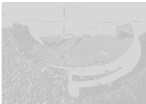
Obr. 111: Opava. Nám. Sv. Hedviky. Sektor B, novověká nádrž. Abb. 111: Opava. St. Hedvika Platz. Der Sektor B, Der neuzeitliche Wasserbehälter.

Okolnosti záchranného archeologického výzkumu (č. akce NPÚ Ostrava 13/08) jsou popsány v kapitole Éneolit (Opava, náměstí Sv. Hedviky, parcela č. 72/2). Kromě pravěkých nálezů zde byly zaznamenány i středověké a novověké situace. Pro vybudování plochy parkoviště byl strojem snížen stávající terén mezi bloky domů v části staveniště (sektor A) cca o 0,6 m. Při jeho ručním začišťení bylo v kulturní vrstvě, narušené novověkou zemědělskou činností, nalezeno několik desítek keramických fragmentů širšího časového rozpětí (počátek