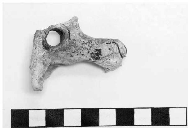
Obr. 86: Litovel, Dukelská ulice. Torzo plastiky glazovaného koníčka. Abb. 86: Litovel (Littau). Dukelská Str. Fragment eines keramischen glasierten Pferdchens.

Archeologický výzkum se proto soustředil i na možné doklady relikvů zaniklých komunikací v tomto prostoru. Úhrnem zde byly zjištěny celkem na čtyři desítky zahloubených sídlištních objektů, převážně malých a středních rozměrů. Překvapivým zjištěním základní stratigrafie na lokalitě bylo, že obdobně jako v případě objeveného předlokačního centra s trhovou funkcí „antiqua civitas“ (Šlězár 2005; Šlězár 2008, 10–27 s lit.) je i zde původně nad okolí mírně vyvýšená poloha, tvořená jemným akumulacním pískem (obr. 87)), v hloubce 0,4–1,0 m pod povrchem o síle max. 0,6 m. Směrem k Dukelské, Žerotínově ulici a Staroměstskému náměstí se mocnost písku zmenšuje a podloží je zde posléze tvořeno již pouze hrubým říčním štěrkopískem v hloubce kolem