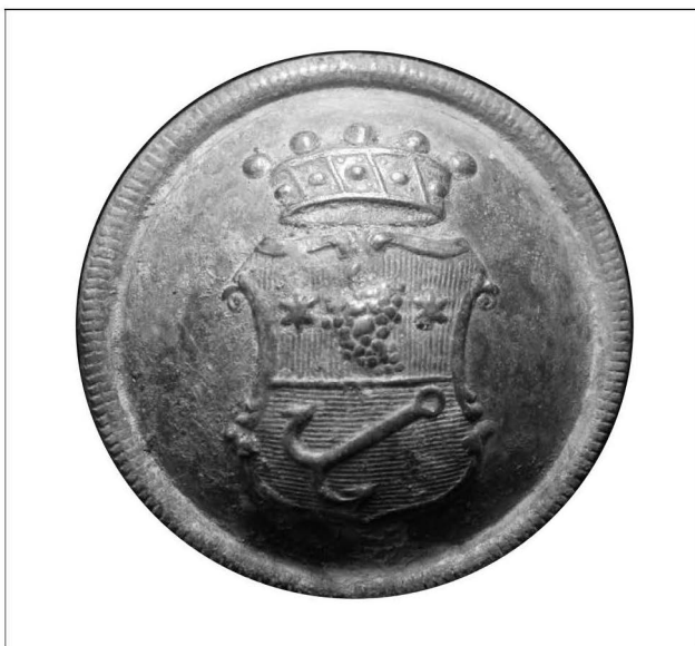
Obr. 79: Chudobín. Detail knoflíku s erbovním znamením rodiny Terschů. Abb. 79: Chudobín. Detail des Knopfsens mit dem Wappen der Familie Tersch.

tečně o základy stavby původní tvrze či pouze hospodářských budov přiléhajícího dvora. Na to, jaký byl skutečný rozsah zachycených stavebních konstrukcí a upřesnění jejich datace v rámci stavebněhistorického vývoje, by odpověděl případný odkryv většího rozsahu.