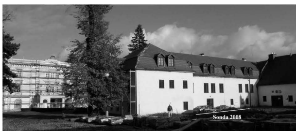
Obr. 77: Chudobín. Zámek. Místo záchranného zkoumaného výzkumu. (Sonda 2008) Abb. 77: Chudobín. Schloss. Die Stellung der Suchgrabung (Sondage 2008)

a ze střední doby hradištní. Lokalita leží na jižním svahu mírného návrší východně od Hulína, ohraničeného na severu říčkou Rusavou a na jihu potokem Žabínek. Lokalitu s nadmořskou výškou 193–198 m lze identifikovat v mapě MZ 1:10 000, list 25–31–08, v souřadnicích Z s.č.: J s.č.: 105 mm : 245 mm, 203 mm : 172 mm, 196 mm : 220 mm.