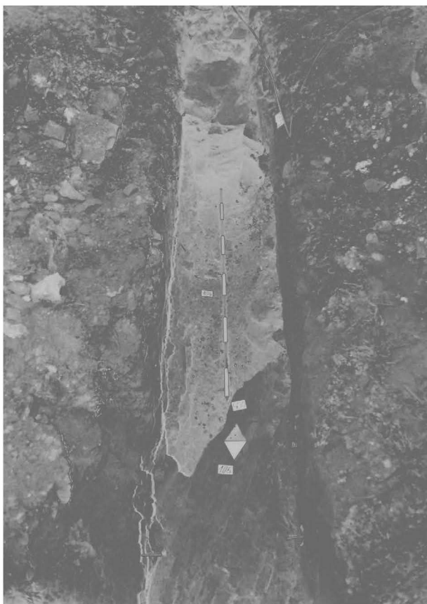
Obr. 76: Hradec nad Moravicí. Zámek. Rezervoár. Abb. 76: Hradec nad Moravicí. Das Schloss. Das Wasserbehälter.