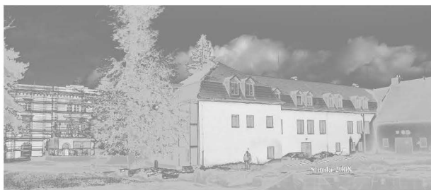
Obr. 77: Chudobín. Zámek. Místo záchraného zkoumaného výzkumu. (Sonda 2008) Abb. 77: Chudobín. Schloss. Die Stellung der Suchgrabung (Sondage 2008)

a ze střední doby hradištní. Lokalita leží na jižním svahu mírného návrší východně od Hulína, ohraničeného na severu říčkou Rusavou a na jihu potokem Žabínek. Lokalitu s nadmořskou výškou 193–198 m lze identifikovat v mapě MZ 1:10 000, list 25–31–08, v souřadnicích Z s.č.:J s.č.: 105 mm : 245 mm, 203 mm : 172 mm, 196 mm : 220 mm.