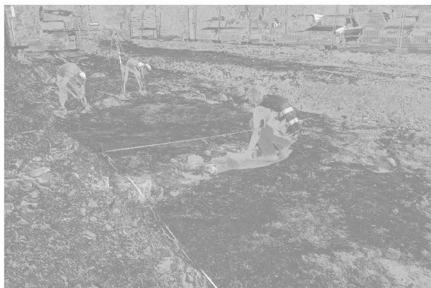
Obr. 74: Frýdek-Místek. Pohled na zkoumanou plochu. Abb. 74: Frýdek-Místek. Blick auf die Grabungsfläche.