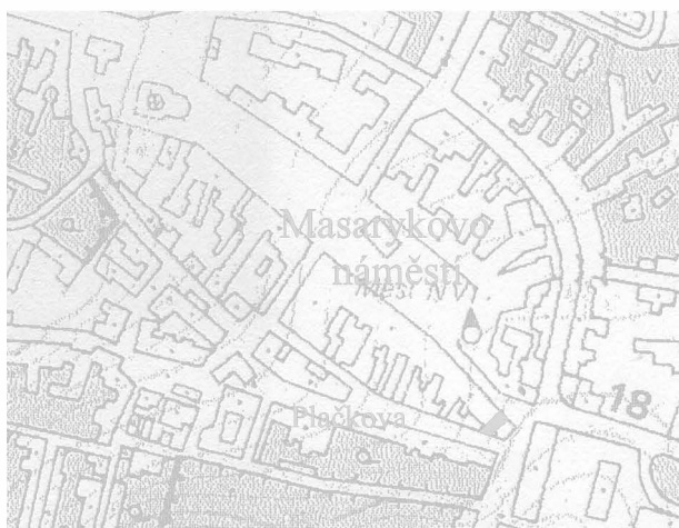
Obr. 3: Boskovice, Masarykovo náměstí, parc. č. 102. Abb. 3: Boskovice, Masaryk Platz, Parz. Nr. 102.