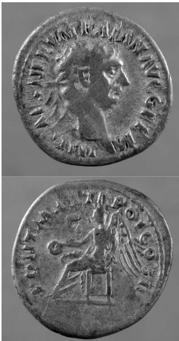
Obr. 11: Ostrožská Lhota, denár císaře Trajána, foto L. Chvalkovský. Fig. 11: Ostrožská Lhota, Denar des Kaisers Trajan, Foto L. Chvalkovský.