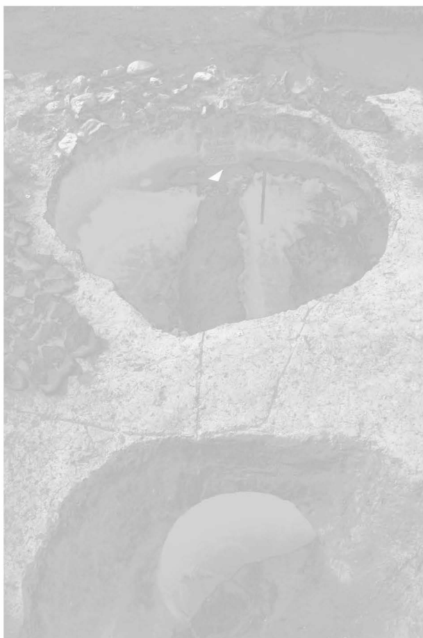
Obr. 10: Opava-Kylešovice (okr. Opava), Komora pece po sejmutí destrukce roštu, uprostřed s opěrným soklem. V popředí část předpeční jámy s propáleným vzduchovým kanálem. Foto P. Stabrava. Fig. 10: Opava-Kylešovice: Der Töpferofenkammer nach Entfernung der zerstörten Rostplatte, in der Mitte mit einer Roststützsäule. Im Vordergrund liegt ein Teil der Bedienungsgrube mit einem verbrannten Heizkanals. Foto P. Stabrava.