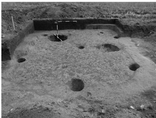
Obr. 6: Mořice, „Pololány u studánky“. Prozkoumaná zemnice s křivou konstrukcí. Fig. 6: Mořice, „Pololány u studánky“. Die untersuchte Hütte mit sechseckigem Hauptpfostenschema.

Archeologicky nejlépe zachycenou etapou osídlení polohy „Pololány u studánky“, k. ú. Mořice, je osada Germánů doby římského císařství. Těto bezpečně náleží celkem 5 archeologických situací – polozahloubená chata,