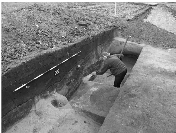
Obr. 8: Mořice, „Pololány u studánky“. Pracovní snímek z odkryvu hliníku s píčkou. Fig. 8: Mořice, „Pololány u studánky“. Foto aus der Ausgrabung.

obr. 301). V regionu Prostějovska jde pak o vůbec první kontrolovatelný fragment TS, jenž navíc pochází z řádného archeologického výzkumu a bezpečného nálezového souboru (cf. Droberjar 1991, 11, 13; Klanicová 2007, 175, tab. 1).