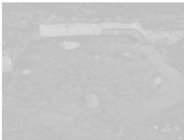
Obr. 6: Mořice, „Pololány u studánky“. Prozkoumaná zemnice s kulovou konstrukcí. Fig. 6: Mořice, „Pololány u studánky“. Die untersuchte Hütte mit sechseckigem Hauptpfostenschema.

Archeologicky nejlépe zachycenou etapou osídlení polohy „Pololány u studánky“, k. ú. Mořice, je osada Germánů doby římského císařství. Těto bezpečně náleží celkem 5 archeologických situací – polozahloubená chata,