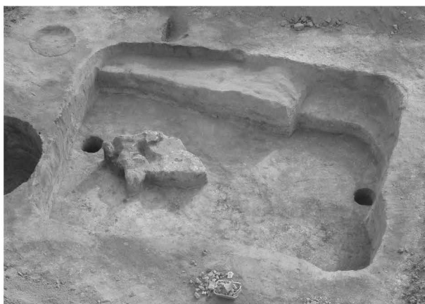
Obr. 3: Polešovice (okr. Uherské Hradiště). Pohled na zemi z doby laténské s mazanovicovou destrukcí otopného zařízení.

V roce 2008 došlo k rozšíření těžby písku v zemníku Orlovice. III. etapa rozšiřuje stávající zemník o dalších 12 ha. Lokalita se nachází u severozápadního okraje orlovického katastru na vrchu Lysá hora, který je předhůřím Litensické pahorkatiny, v nadmořské výšce 366 m. Zkoumaná plocha leží na vrcholu a na západním svahu hřbetu