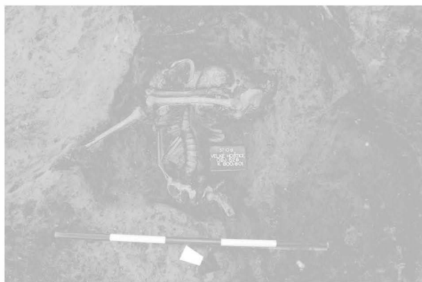
Obr. 26: Velké Hoštice. „Za humny“. Detail pohřbu v sídlištní jámě (obj. 526) KLPP. Abb. 26: Velké Hoštice. „Za humny“. Detail des Begräbnis in der Siedlungsgrube (Obj. 526) Lausitzer Urnenfelderkultur (schlesische Phase).