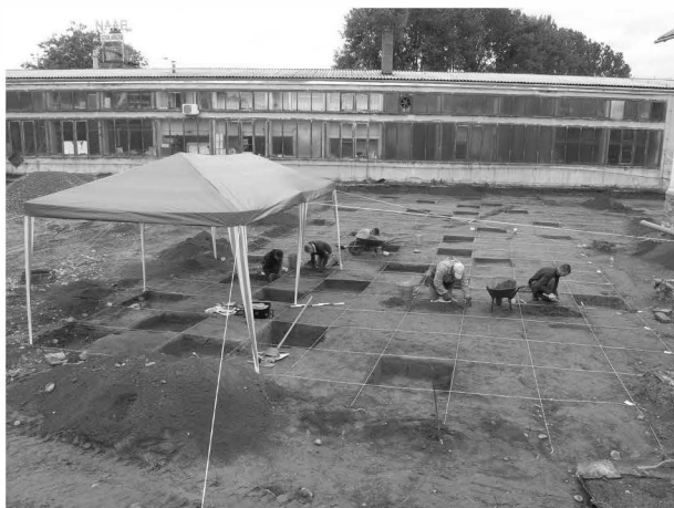
Obr. 22: Šumperk. Výzkum vrstvy ve čtvercové síti. Abb. 22: Šumperk. Die Ausgrabungsfläche.

zásobnic, početnou kolekci kostěných nástrojů, retušovaných štípaných nástrojů a kulovitých kamenných ortidel.