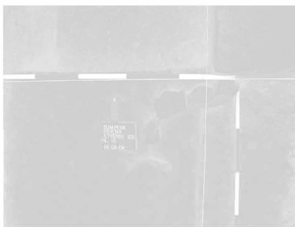
Obr. 23: Šumperk. Kumulace keramiky ve čtvercích 102 a 103. Abb. 23: Šumperk. Das Scherbenlager in den Sektoren 102 u. 103.

zásobnic, početnou kolekci kostěných nástrojů, retušovaných štípaných nástrojů a kulovitých kamenných nrtidel.