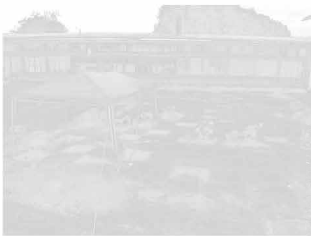
Obr. 22: Šumperk. Výzkum vrstvy ve čtvercové síti. Abb. 22: Šumperk. Die Ausgrabungsfläche.