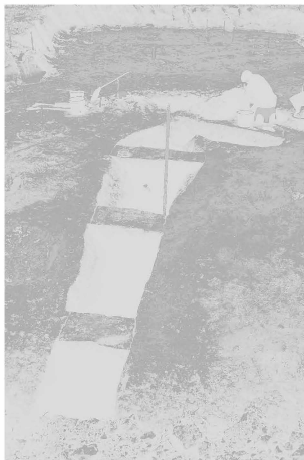
Obr. 14: Opava-Kylešovice: Pohled na zkoumanou část příkopu (obj. 520) od jihu. Ukončení příkopu se nachází v těsném kontaktu s obj. 519. Stav během výzkumu. Fig. 14: Opava-Kylešovice: Excavated part of a ditch (feature Nr. 520) viewed from the south. The end of the ditch is situated in the direct contact with the feature Nr. 519.

V roce 2008 pokračoval výzkum na polykulturní sídlištní lokalitě v bývalé polní trati „Na stanech“ (srv. PV za rok 2007). Zkoumány byly jednotlivé parcely, respektive jejich části zasažené výstavbou jednotlivých RD. Celkem zde bylo během této etapy prozkoumáno 32 ploch pro RD a větší souvislá plocha u železniční trati určená pro výstavbu 4 řadových RD. V rámci uvedených ploch bylo prozkoumáno značné množství objektů, které na základě náleзовého fondu můžeme chronologicky zařadit do období popelnicových polí doby bronzové. Vedle množství klasických zahloubených objektů různých velikostí zde byla na parcele č. 2724/6 objevena i část příkopu zatím blíže neznámého účelu (14). Ten byl poměrně hluboký, orientovaný ve směru S–J, a na jižní straně pokračoval za hranici zkoumané plochy. Stěny příkopu byly ve svrchní části šikmé až strmě šikmé, v části spodní pak kolmé. Dno bylo v podélné ose zvlněné, v příčné pak mělo nísovitý charakter. Objekt byl prozkoumán čtyřmi sondami (A až D), které byly odděleny cca 50 cm širokými