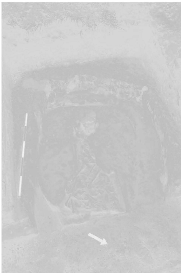
Obr. 2: Branišovice. Druhotně otevřený hrob. Abb. 2: Branišovice. Sekundär geöffnete Grab.

Podborský, V., Vildomec, V. 1972: Pravěk Znojemska , Brno: Musejní spolek v Brně–Jihomoravské muzeum ve Znojmě.