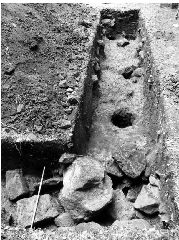
Obr. 3: Buchlovice. Holý kopec. Pohled na část sondy s kameným závalem a kúlovými jámami. Foto M. Vaškových. Abb. 3: Buchlovice. Holý kopec. Blick auf Teil der Sonde mit einer Steinfüllung und den Pfostengruben. Foto M. Vaškových.

hutných kúlech (průměr 40–60 cm), které tvořily jednoduchou linii. V hloubce 60–80 cm byla zachycena mohutná kulturní vrstva, která obsahovala větší množství keramiky předběžně datované do pozdního období kultury lužických popelnicových polí. Souběžně se zjišťovacím výzkumem proběhl ve spolupráci s Archeologickým ústavem AV ČR v Brně, v. v. i. (O. Šedo) v dolní části hradiška průzkum pomocí hloubkového detektoru, který přinesl pouze ojedinělé, blíže nedatované nálezy železných předmětů a jejich zlomků.