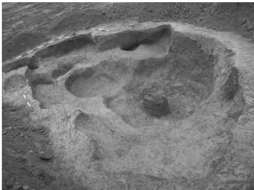
Obr. 8. Vlachov, naleziště U kříže. Objekt 500.