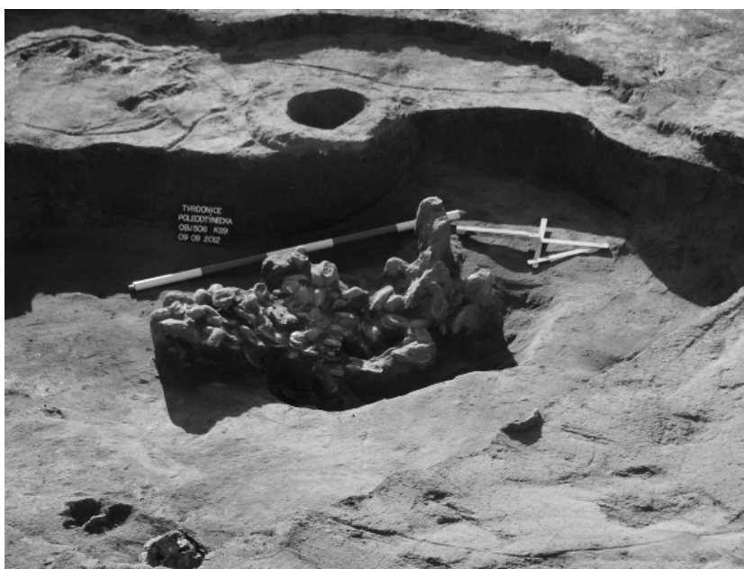
Fig. 16. Tvrdonice. Unio shell midden in the top part of storage pit.

On the opposite side of the Svodnice creek, field track "Od Týnecka", five features were excavated. Based on one pottery shard, the datation might be also EBA.