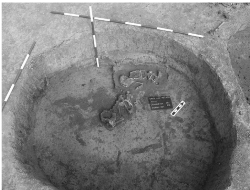
Abb. 7. Osek nad Bečvou. Objekt 84 mit zwei Kinderbestattungen. Aunjetitzer Kultur.

ní jámy. V jednom z hliníků bylo zjištěno také několik kůlových jamek - zbytků obydlí nebo (pravděpodobněji) přístřešku nad hospodářskými jámami či nad výrobní zónou.