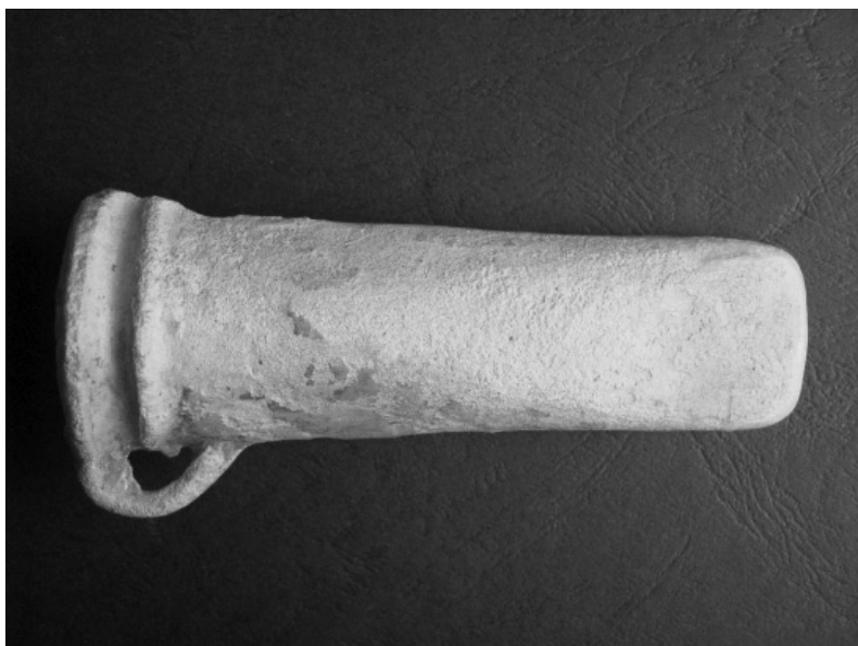
Obr. 10. Pozlovice. Bronzová sekerka s tulejkou.