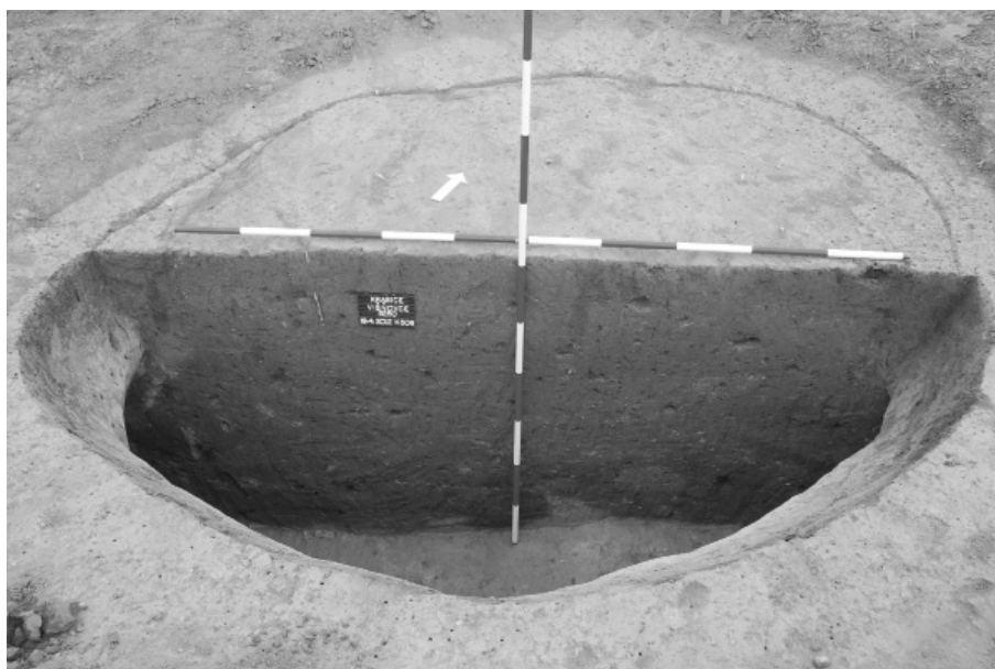
Abb. 12. Prostějov-Krasice. Blick auf das ausgegrabene Objekt Nr. 506.

- Program rektora na podporu tvůrčí činnosti studentů. Dílčí analýzy keramiky byly provedeny v rámci projektu (GD404/09/H020) - „Moravskoslezská škola doktorandských studií II“.