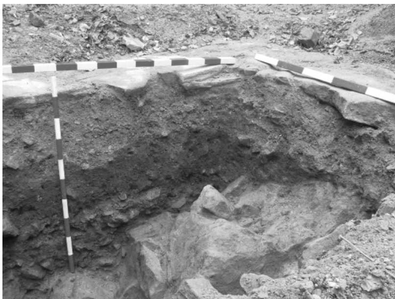
Obr. 2. Hrad Lukov. Zjišťovací sonda. Abb. 2. Burg Lukov. Sondierungsgrabung.

ni polovině 13. století zbudován středověký hrad, bylo doloženo již v dřívějších výzkumných sezónách sekundárními nálezy pravěké keramiky v obsahu středověkých vrstev, zejména v prostoru jižního parkánu.