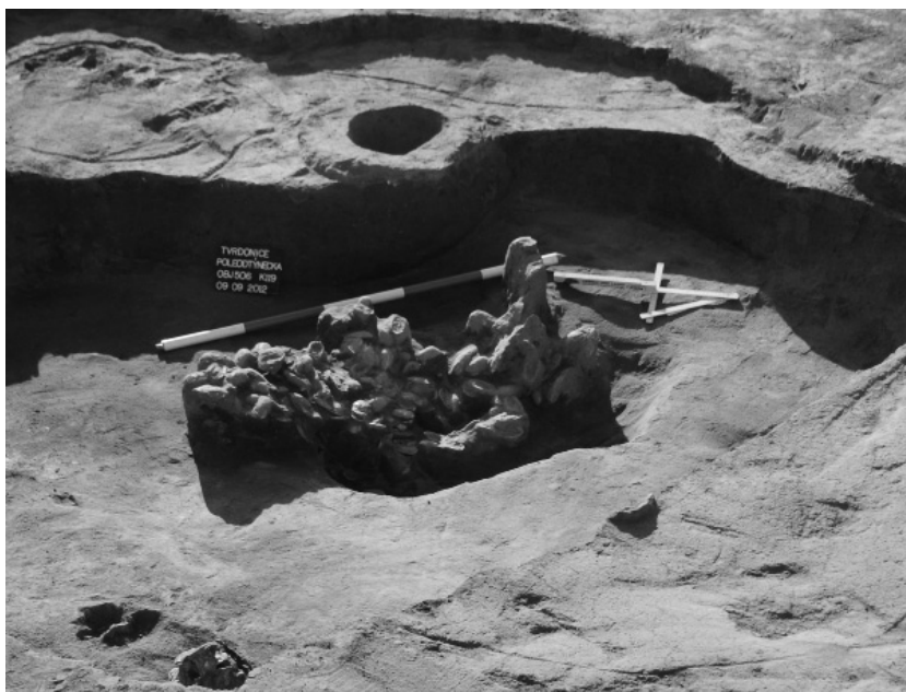
Fig. 16. Tvrdonice. Unio shell midden in the top part of storage pit.

On the opposite side of the Svodnice creek, field track "Od Týnecka", five features we excavated. Based on one pottery shard, the datation might be also EBA.