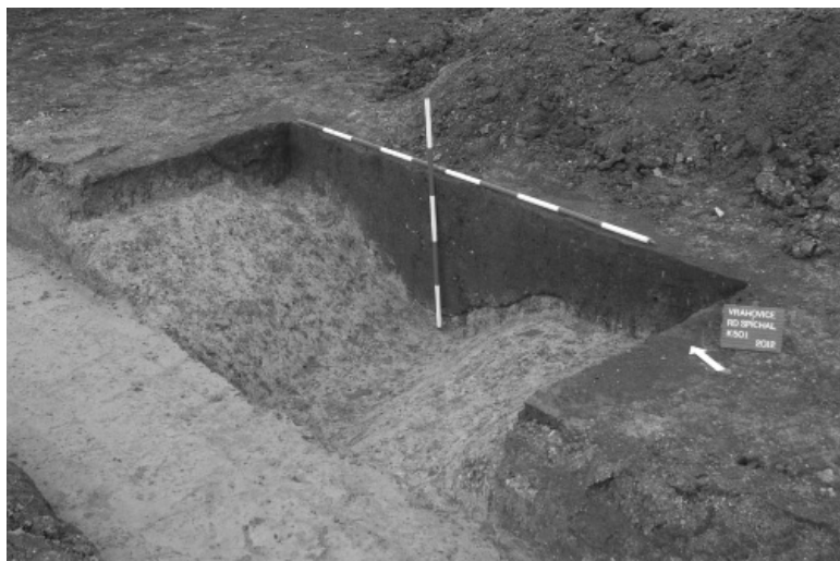
Obr. 12. Prostějov-Vrahovice, „Trávníky“. Příkop kultury s lineární keramikou.