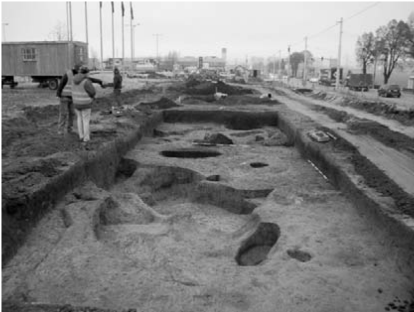
Obr. 26. Zlín (k. ú. Malenovice, okr. Zlín). Pohled na plochu výzkumu.